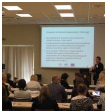
Įvadinio seminaro Klaipėdoje viešoji dalis

Įvadinis seminaras labai sėkmingai įvyko rugsėjo mėnesį 2011 metais Klaipėdoje, Lietuvoje.